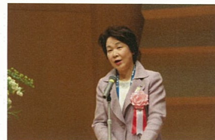
吉村美栄子山形県知事