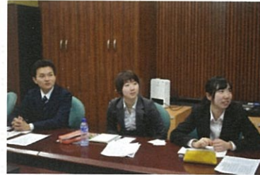
モンゴル語研修の様子