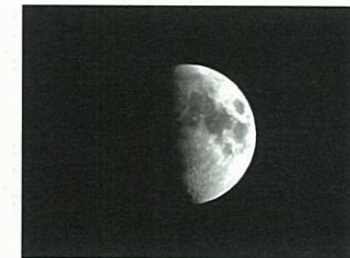
月面(サブスコープ)