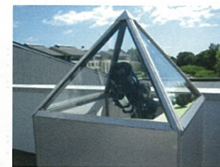
ニューヨークインターネット望遠鏡