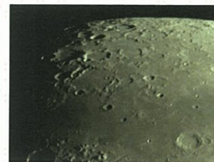
月面(メインカメラ)